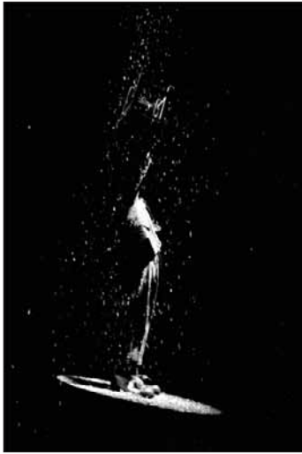
Lluvia, de la serie Teatro en Madrid