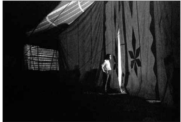
Esperando su momento