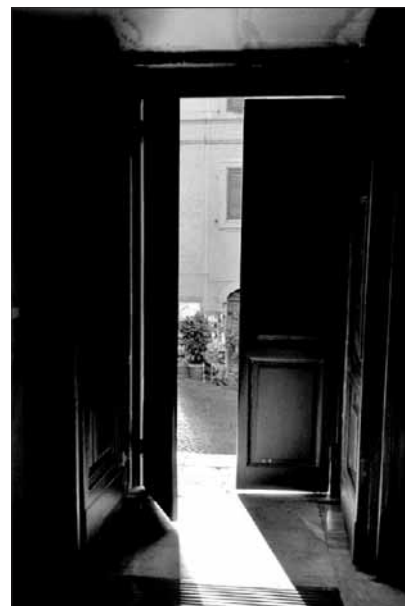
Iglesia de San Agustín (Roma)