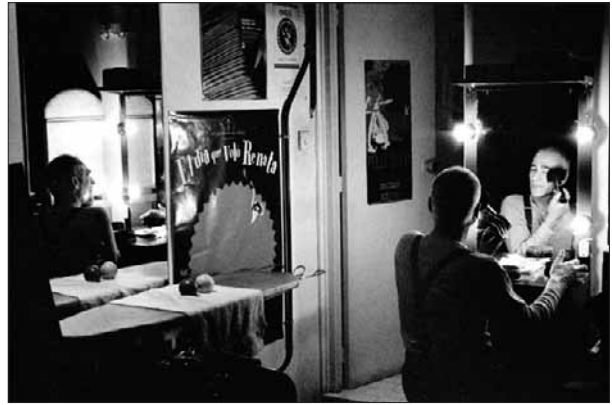
En el camerino