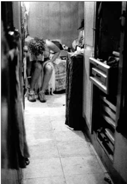
Preparándose para actuar