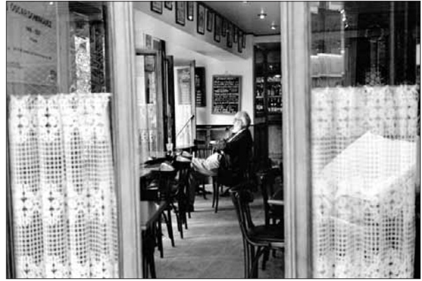
Café de París