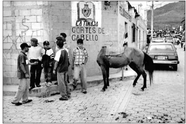
Cortes de cabello