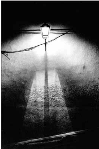
Farola, de la serie Instantes

Bajo el título Momentos se propone un recorrido por una selección de 40 instantáneas en blanco y negro captadas por la cámara de Abraham Ruiz en diferentes lugares del mundo durante los últimos años.