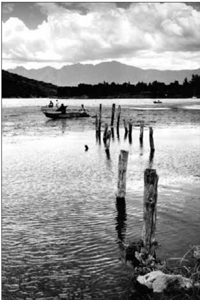
Pescadores en el lago Atitlán